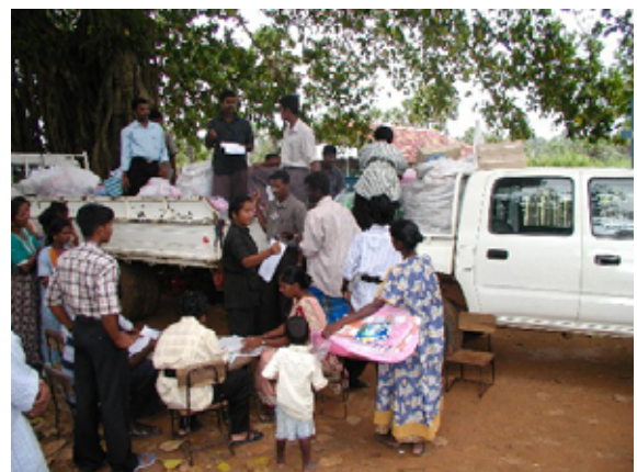
スリランカ 避難所で衣類を配布 Distribution of clothes In Sri Lanka

The coastlines of Sri Lanka, suffered from the catastrophic Sumatora tsunami on December 26, 2004. More than 30,000 people died; over 800,000 were displaced after the disaster. With the aid of local NGOs food, water and clothing were distributed to evacuees' camps in the area. Two JEN staff members arrived in Sri Lanka on December 30 and executed needs assessment for emergency assistance and long-term reconstruction beginning in 2005.