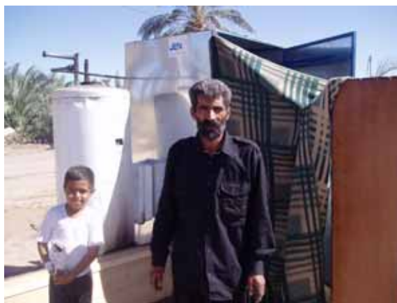
イラン 設置したばかりの避難所のシャワー Installation of shower in Iran

2003年12月26日にイラン東南部ケルマン州バム市で地震が発生し、バム市の人口約12万人の内、死者数約4万3千人余、負傷者約3万人に達し、生存者のほぼ全員が家屋を失いました。被害状況が同様で、支援の行き届いていないバム市郊外のバラバット地区で、JENは緊急支援活動を行いました。テント生活を送る被災者に、衛生状態改善のために簡易シャワーとトイレの設置を行い、また石鹸、シャンプーを含む衛生用品セットの配布を、孤児院では日本の企業の協力により玩具を配布しました。この事業は5月に終了しました。