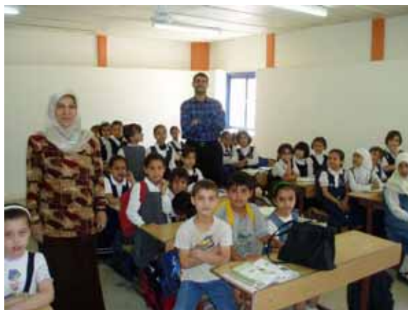
イラク きれいになった教室で生徒と先生 Students and teachers in reconstructed class in Iraq

Security in Iraq has worsened since the US declared an end to major combat operation in May 2003. Consequently, most of international staff from international NGOs have relocated from Baghdad. Under the supervision of international staff based in Amman local staff renovated elementary schools as well as parts of major sewage systems. In this particular project JEN employed over 600 Iraqi people.