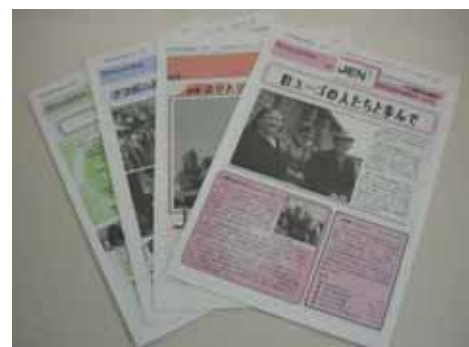
年4回発行のJENニュースレター JEN's News Letter which is published quarterly

Number of companies supported JEN in different ways: by providing Internet one-click donations; assisting with the printing of newsletters; implementing charity concerts; and, renting warehouses for storing documents.