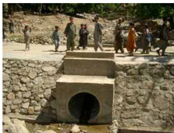
アフガニスタン 完成したばかりの橋を渡る子どもたち Children on the bridge newly constructed by JEN

帰還民、及び受け入れ先となる地域住民に対し、自助自立につながる復興プログラムを社会、経済、生活、保健衛生など総合的な支援を行いました。