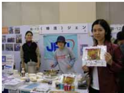
サポーターによるアフガン風シチューの販売 Selling Afghan stew at an event by supporters

またJEN主催のイベントとして、1月にアフガニスタン写真展、2月にシンポジウム「戦争と人道支援」、その他海外駐在スタッフの帰国報告会や活動報告会を実施し、スタッフと支援者の方々との交流の場になるようにも努めました。