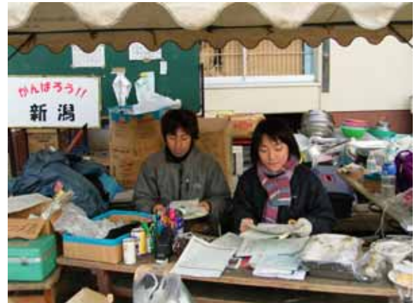
新潟県 川口町ボランティアセンターで受付をする JENスタッフとボランティア JEN staff and volunteer at Volunteer center in Kawaguchimachi, Niigata

A powerful earthquake occurred in North West Japan on December 23, 2004. It killed 46 people and 4,800 were injured; 15,500 houses were partially or completely destroyed. An abundance of emergency supplies were collected and hundreds of volunteers nationwide responded, overwhelming local government. From the experiences of overseas involvements, JEN efficiently took a part of volunteer coordination. JEN organized rehabilitation activities to meet the needs of sufferers in Tokamachi and Kawaguchimachi while managing the volunteer office in Kawaguchimachi. Even though these projects ended officially on December 20, JEN has decided to maintain support in the area in 2005 as well.