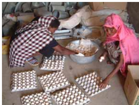
エリトリア 生まれたての卵を選別する組合員の女性たち Income generation by poultry farming project

Female households have begun vocational training to generate income via poultry farming and other agricultural initiatives. These projects have been fruitful since many project participants are now able to obtain nutritional support for themselves and their families.