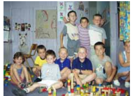
セルビア・モンテネグロ ワークショップ参加の子どもたち Workshop for children in Serbia