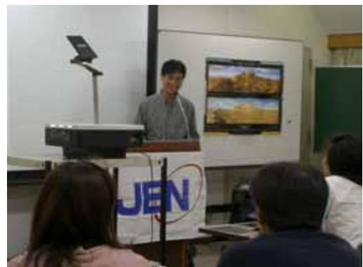
JENスタッフによるイラン活動報告会 Reporting of Iran Project by JEN's staff

Our supporters have diverse background: students, retirees, office workers and housewives contribute to accomplish JEN's mission. On weekdays, they commit to office works at our Tokyo headquarters and on weekends, they facilitate a variety of events. In March JEN Supporters Club (JSC) spearheaded an event that independently supports Afghanistan. JSC also executed its own fund-raising campaign via the sale of Afghan food (stew) and running flea market. JSC donated JPY163,305 to JEN at the end of 2004.