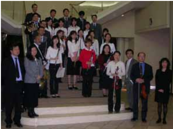
12月に行われたチャリティーコンサート Charity concert in December

JEN sells handicraft cards and beautiful room shoes (called Zepa in Serbo-Croatian) made by female refugees and IDPs in the former Yugoslavia. This allows them to generate a modest income. On-line and at events our "Remember Afghanistan?" T-shirts and cards, as well as books that convey information of our activities are sold. These goods are a reflection of our activities and serve as educational material for those interested in supporting people in need of assistance.