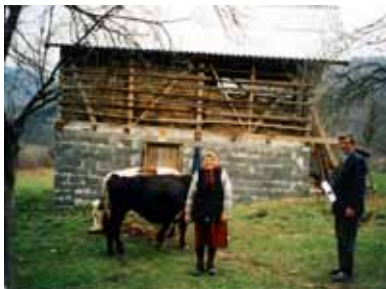
ボスニア・ヘルツェゴビナ 家畜小屋再建事業 Reconstruction of stable project in Bosnia & Herzegovina

The repatriation and resettlement of refugees have transpired smoothly. Unlike previous years, the domestic economy has steadily improved. JEN implemented projects of reconstructing infrastructure as well as income generating projects. Consequently, JEN finished its nine year mission in Bosnia and Herzegovina at the end of October, 2004. This was also the end of JEN's decade-long mission in the former Yugoslavia.