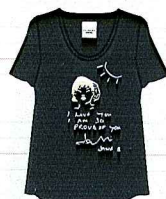
チャコール グレー

BEAMSバージョンは クリーム、チャコール グレー、ブラック×ホ ワイトボーダーの3色 展開です。