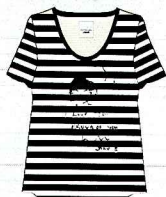
ブラック× ホワイトボーダー