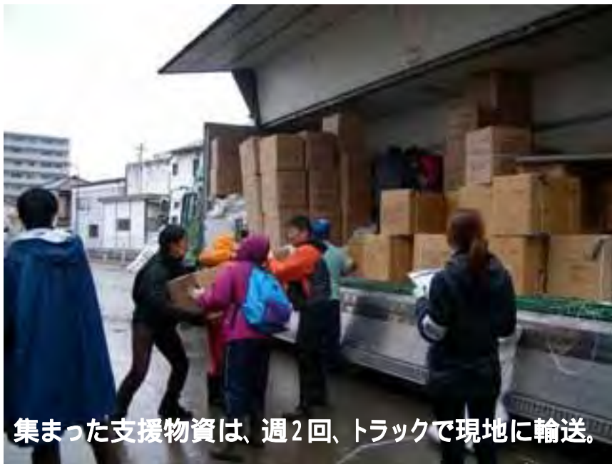
集まった支援物資は、週2回、トラックで現地に輸送。

仕分けの時間を短縮し、最速で現地にお届けするためにアイテム制限や梱包方法、物資の仕様を細かく指定。それにも関わらず、たくさんの皆様にご協力を頂き、必要とされる物資を時差なく現地にお届けすることができました。