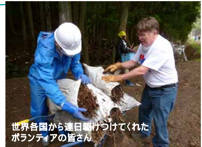
世界各国から連日駆けつけてくれたボランティアの皆さん

この原稿を書きながら、東日本大震災の被災地で困難な状況のまただ中にある人々のことを考えています。人道支援に従事するジェンの一員として、いま物理的に被災地に行くことはできませんが、祈りをささげたいと思います。日本はこの困難な状況を乗り越え、再び立ち上がることができると思っています。日本の全ての人びとに、平穏な日常が戻ってくることを心から祈っています。