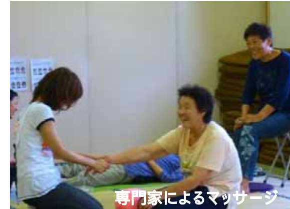
専門家によるマッサージ

ピーク時には約2,600人の避難所となっていた石巻市立湊小学校にて、避難所運営のサポートや各種活動を通じた心のケアを実施しました。被災の経験に加えて、長引く避難生活やプライバシーがない環境での生活はストレスが多く、精神的にも負担がかかります。避難所での生活環境を改善することで、前向きな心を取り戻していただくための活動を行いました。