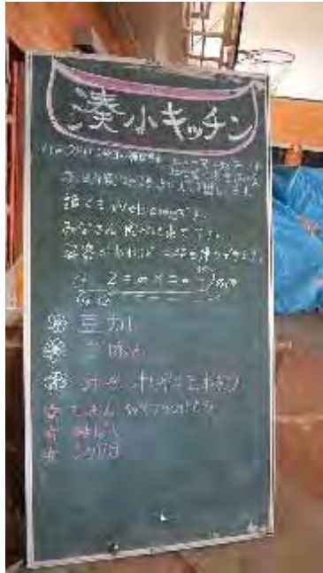
(左)住民の方々による「湊小キッチン」