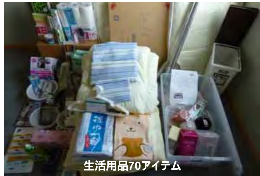
生活用品70アイテム