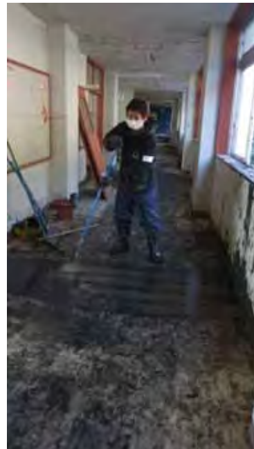
(右)ボランティアの皆さんによる避難所の清掃活動