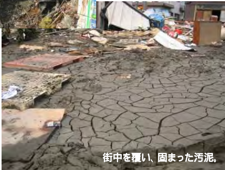
街中を覆い、固まった汚泥。

重機では撤去できない、家々の細かいお掃除や地域の環境を復旧するために、ボランティアの受け入れを行いました。「マッドバスターズ」と名付けられたこのボランティアには、国内外から、約4,600人もの方々が参加してくださいました。