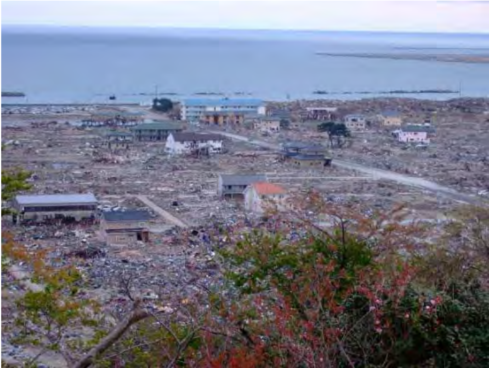
石巻市市街地の被害(2011年5月。日和山公園より撮影)