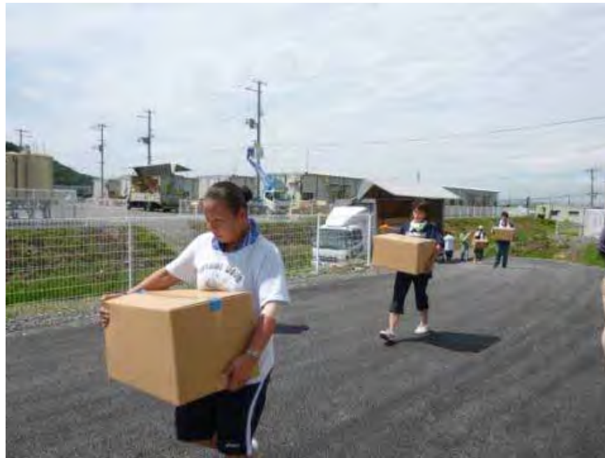
(左) 地域のアルバイトや全国からのボランティアの方々により 一戸一戸への配布を実施

避難所で生活を送る方々のサポートをする一方で、4月末から順次始まる仮設住宅への入居の準備がスタートしました。仮設住宅へ入居された方々が、入居したその日から日常生活が始められるよう、13,070世帯(プレハブ仮設住宅6,890世帯、みなし仮設住宅6,180世帯)へ約70種類の生活必需品を配布しました。