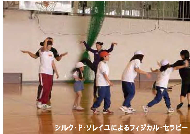
シルク・ド・ソレイユによるフィジカル・セラピー