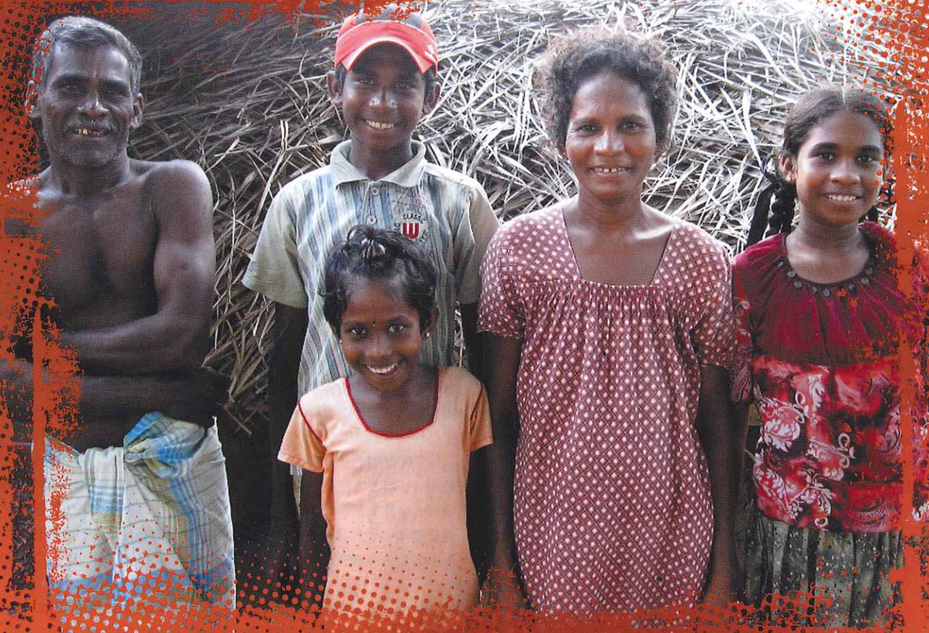
スリランカ SRI LANKA

JEN supports people's "Self Reliance" by delivering the assistance for those who have been inflicted by conflicts and natural disasters. Most of the countries except Haiti, Indonesia and Niigata among nine countries where JEN carried out our assistance projects had either security or political issues which caused our International Staff not to enter the project site. Thus, capacity building of local staff was indispensable, in order to implement sustainable assistance. Our local staff had achieved our mission "Self Reliance" with the strong involvement from the local communities.